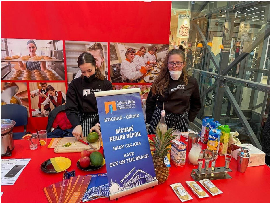
VYSOČINA EDUCATION FESTIVAL V JIHLAVĚ