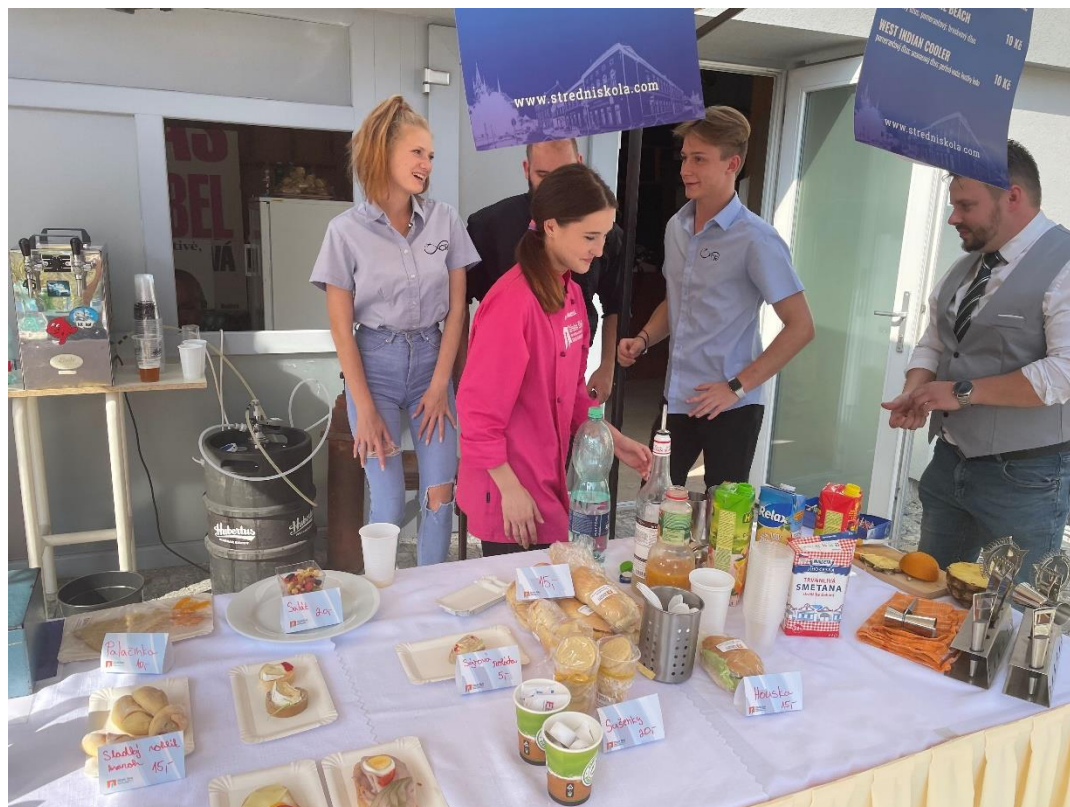
FESTIVAL FIREM V HUMPOLCI