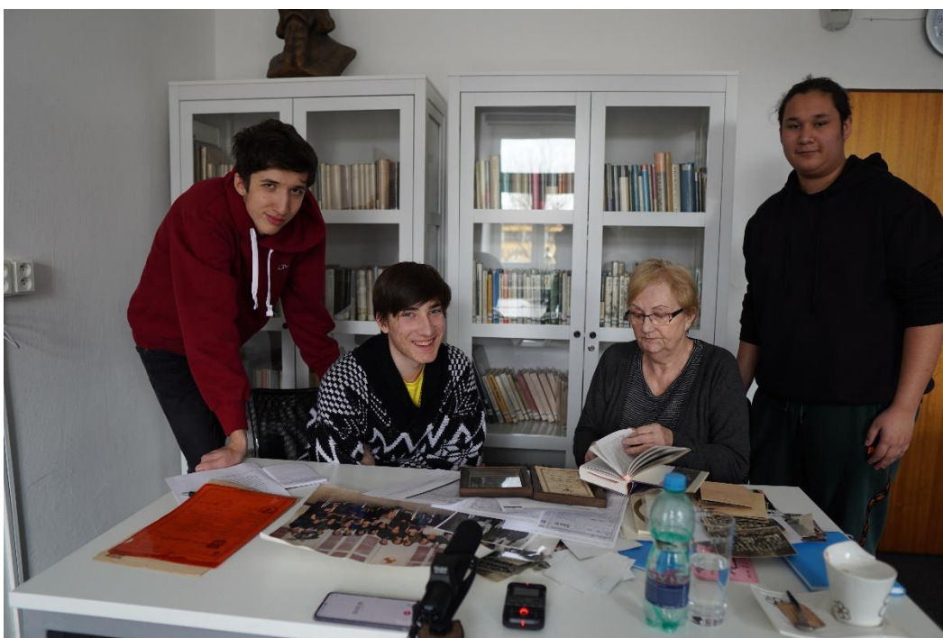
Post Bellum – Příběhy našich sousedů