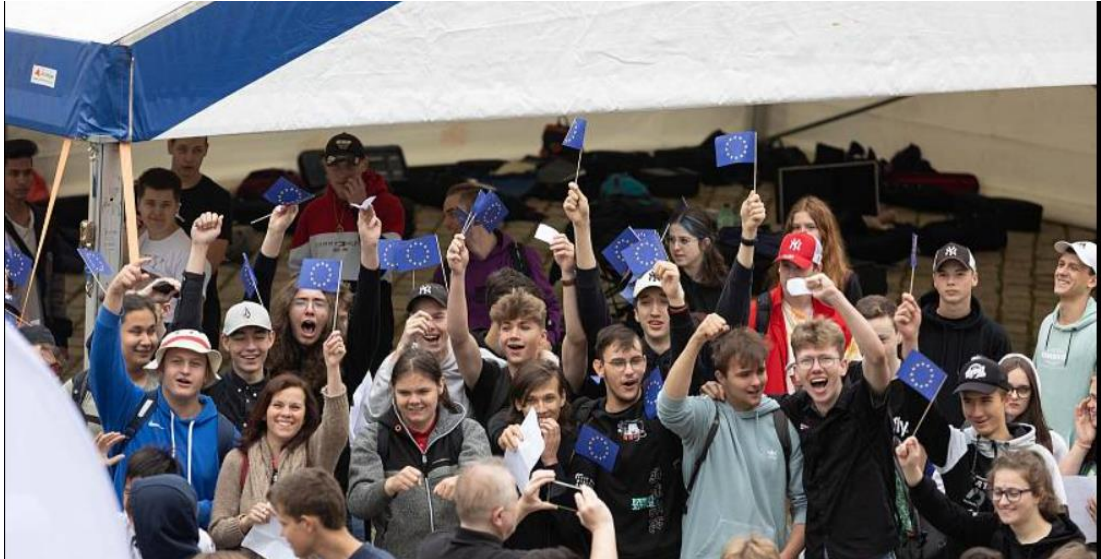
ÓDA NA RADOST