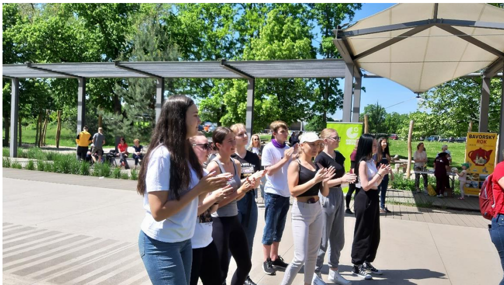
DEN S NĚMČINOU